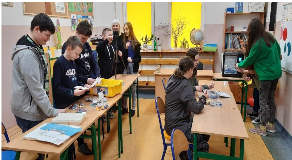
Uczniowie z Publicznej Szkoły Podstawowej w Bukównie

przyszłości, takich jak współpraca, interdyscyplinarność, kreatywność i rozwiązywanie problemów. W ramach programu zakupione zostaną między innymi drukarki 3D wraz z akcesoriami, mikrokontrolery z czujnikami i akcesoriami, lutownice, kamery i aparaty fotograficzne wraz z akcesoriami i inne pomoce ujęte w katalogu wyposażenia. Wsparcie było