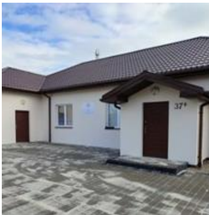
Utwardzenie placu przy budynku świetlicy wiejskiej w Branicy

z tego środki z dotacji Mazowiecki Instrument Aktywizacji Sołectw to 10.000,- zł i środki własne gminy to 10.000,- zł .