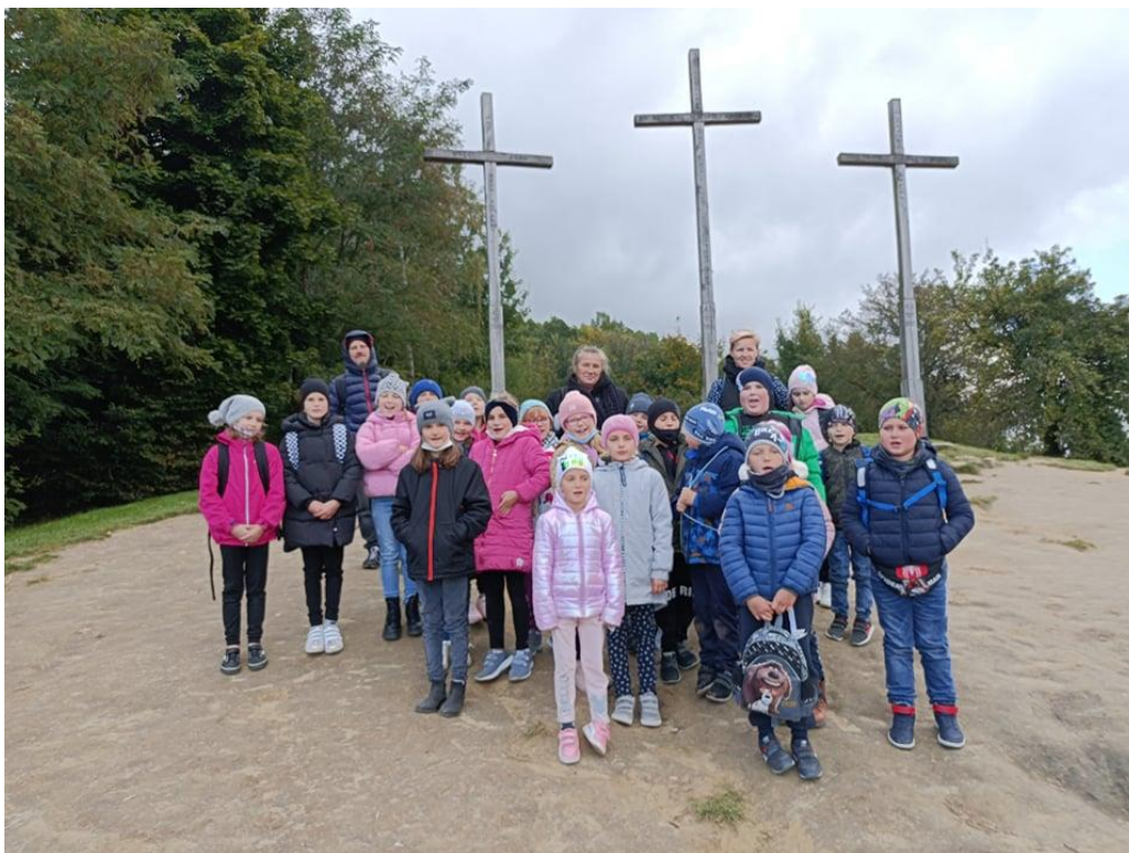
Uczniowie z Publicznej Szkoły Podstawowej z Czarnocinie w Kazimierzu Dolny

wyjechali do Warszawy. W wycieczkach wzięli udział wszyscy uczniowie ze szkół podstawowych z terenu gminy z kl. I-VIII, udział w wycieczkach był bezpłatny.