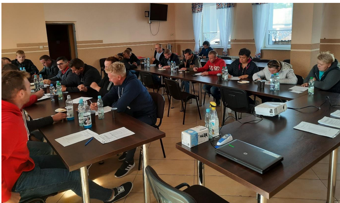
Szkolenie w zakresie stosowania środków ochrony roślin w Radzanowie

W ramach promocji LOWE zamieszczone zostały informacje o działalności ośrodka i ofercie edukacyjnej na stronie Publicznej Szkoły Podstawowej im. Henryka Sienkiewicza w Rogolinie. Informacje o LOWE w Gminie Radzanów pojawiły się też na profilu szkoły na Facebooku.