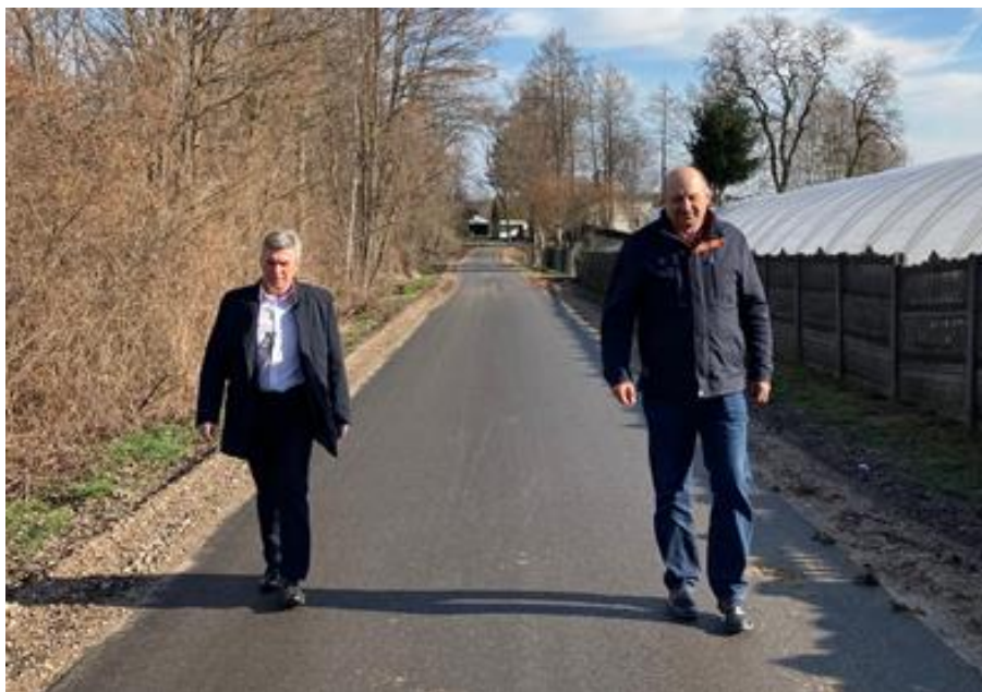
„Przebudowa drogi wewnętrznej w miejscowości Bleszno – Stara Wieś”