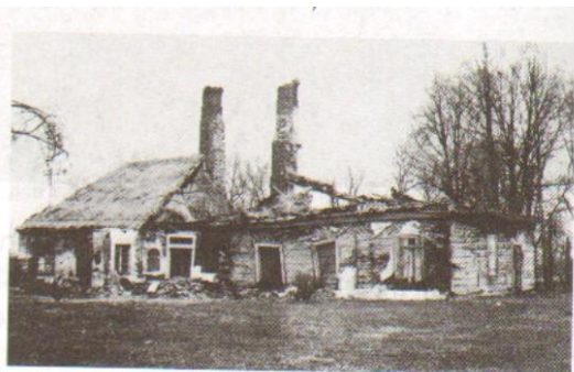
Branica, pow. białobrzegi. Dwór z pocz. XIX w., stan w 1970 r. Fot. R. Brykowski

Źródło: 615 lat Radzanów i okolice, 1391-2006, Stowarzyszenie Oświatowe Sycyna