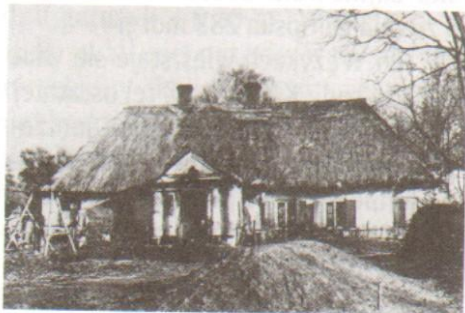
Branica, pow. białobrzegi. Dwór z pocz. XIX w., stan w 1960 r.